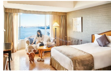
ドッグフレンドリーフロア客室イメージ

・事前にご宿泊滞在同意書および東京ウォータータクシー同意書をご記入の上、ご宿泊前日15時までに提出。