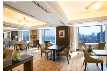
20階にあるクラブインターコンチネンタルラウンジ

* 当面の間、営業時間およびサービス内容を変更しております。詳しくはホームページをご覧ください。