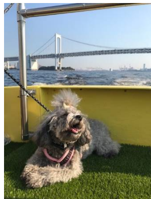
ドッグフレンドリーな船内

新型コロナウイルス感染症の取り組みについて、インターコンチネンタル ホテルズ & リゾーツについて