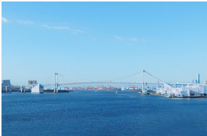
定期的な出張の滞在や、オフィスユースにもお勧めのプラン