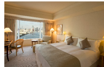
レギュラーフロア客室(リバービュー)イメージ

[添付資料]新型コロナウイルス感染症への当ホテルの取り組みについて、インターコンチネンタルホテルズ&amp;リゾーツについて