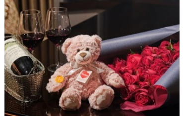
30周年宿泊プランもティディベア付きをご用意

本リリースに関するお問い合わせ先 ホテル インターコンチネンタル 東京ベイ 広報担当:白石、鷹見、山崎、チェンバレン Tel: 03-5404-3913 / Fax: 03-5404-3919 / Email: pr@interconti-tokyo.com