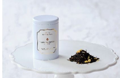
「オリエンタルダーズリン・エレガンス」