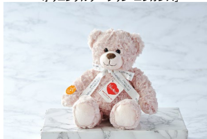
ドイツのハーマンティディオオリジナル社のティディベア