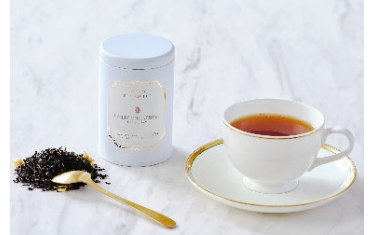
30年の時を超えた気品あふれる香りと余韻