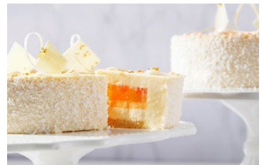
ホワイトとオレンジのコントラストが美しい断面