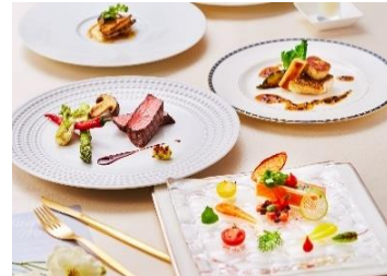
▲低アレルギー対応の料理コース