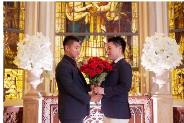
▲LGBTQ+のお客様の施設利用イメージ