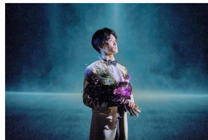
3/秋<唯一のあなた> フォーマルハウト