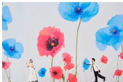
1/春<出会い> スピカとアルクトゥルス

結婚を迎えたふたりの人生を「星巡りの旅」に例えて、出会いから未来へつながる5つのシーンを紡ぎだしました。星・季節・花をテーマにそれぞれの物語を美しいビジュアルに仕上げました。ひとつの空間からさまざまな景色が生まれ、ここプラネタリアTOKYOでしか創り出せない瞬間を残します。