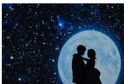
2/夏<運命> ベガとアルタイル・織姫と彦星