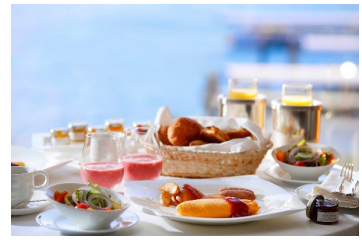
サステナブルへの共感と農家への応援から生まれたストロベリースムージーを用意