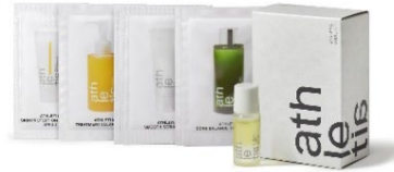
Athletiaのトライアルキット(イメージ)