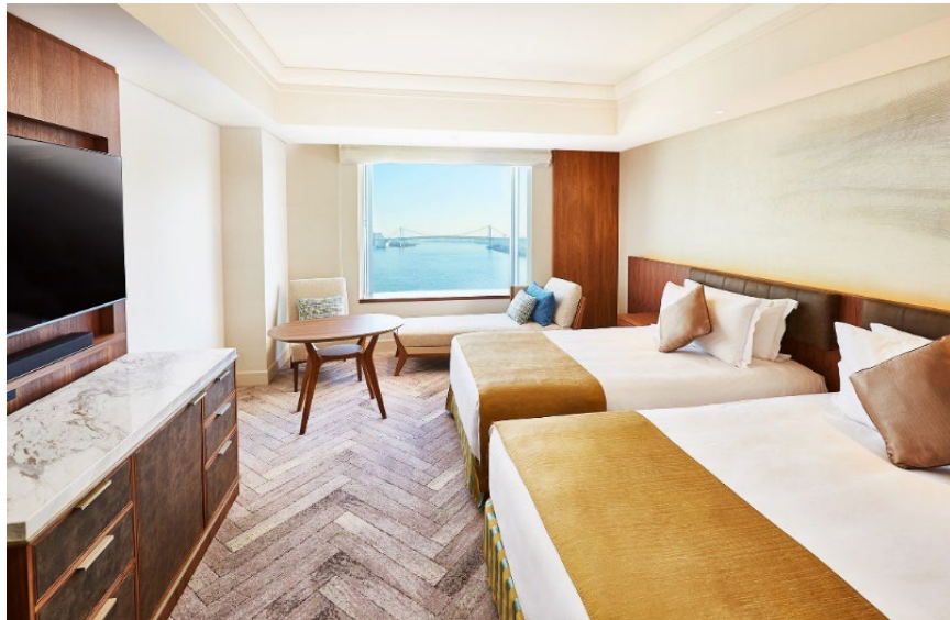
「デラックスフロア」客室(イメージ)

宿泊期間：2023年1月15日(日)～3月16日(木) ※2022年12月26日(月)12時より予約開始