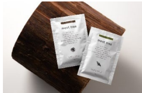
meet treeよりのバスソルト(イメージ)