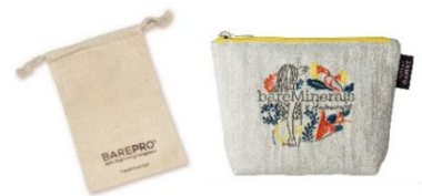
(左)bareMinerals ポーチ (右)10名様限定のZampプロジェクトポーチ