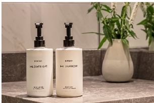
ポンプ式ボトルでの詰め替え運用を導入