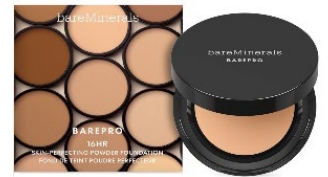
bareMineralsのパウダーファンデーション(イメージ)