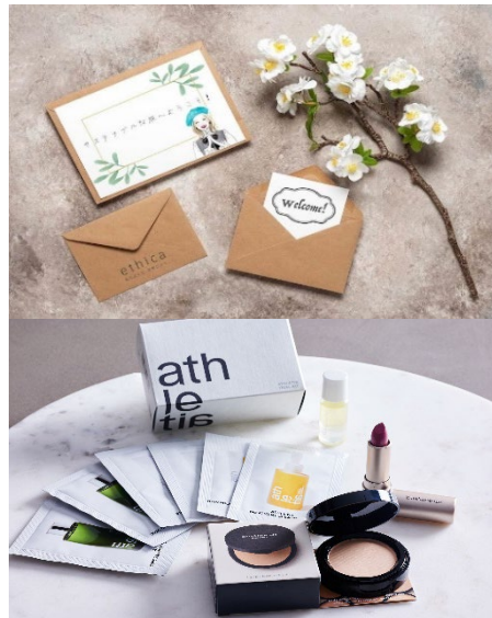
(上)エシカ編集部からのお手紙(下)スペシャルアメニティをプレゼント

ホテル インターコンチネンタル 東京ベイ(所在地:東京都港区海岸1丁目16番2号、総支配人:宮田 宏之)では、1月15日より「私によって、世界にイイ。」をコンセプトにしたwebマガジン「ethica(エシカ)」との企画により、athletia(アスレティア)、bareMinerals(ベアミネラル)、meet tree(ミートトゥリー)とコラボレーションした「スペシャルアメニティ付きエシカ宿泊プラン」を期間限定で販売いたします。